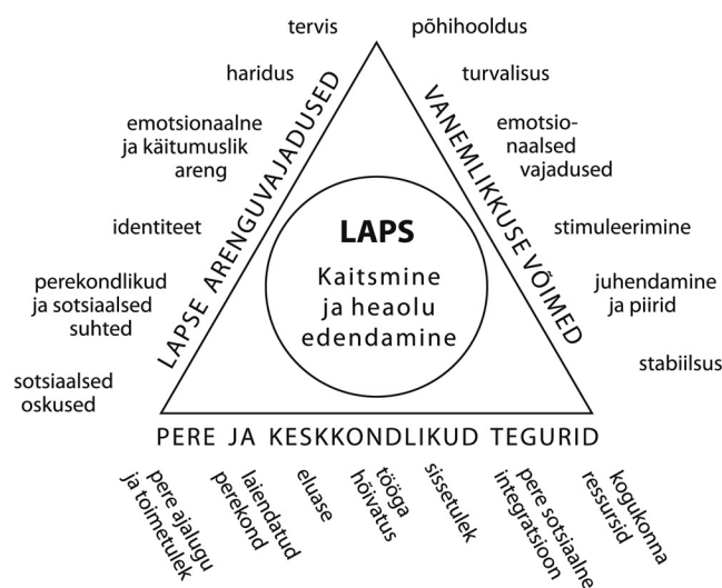
Joonis 1. Laste ja perede vajaduste hindamise raamistik (Department of Health 2000, 19).